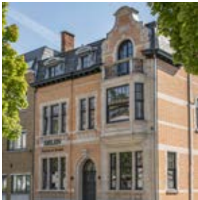
HASSELT Thonissenlaan 11 3500 Hasselt +32 (0)11 71 10 10