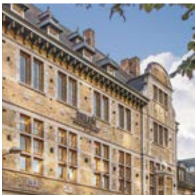
LUIK Boulevard d'Avroy 4 4000 Luik +32 (0)4 232 28 11